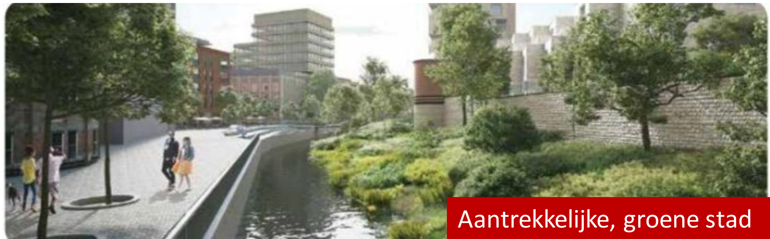
Aantrekkelijke, groene stad