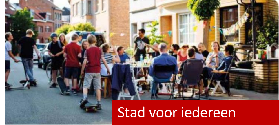
Stad voor iedereen