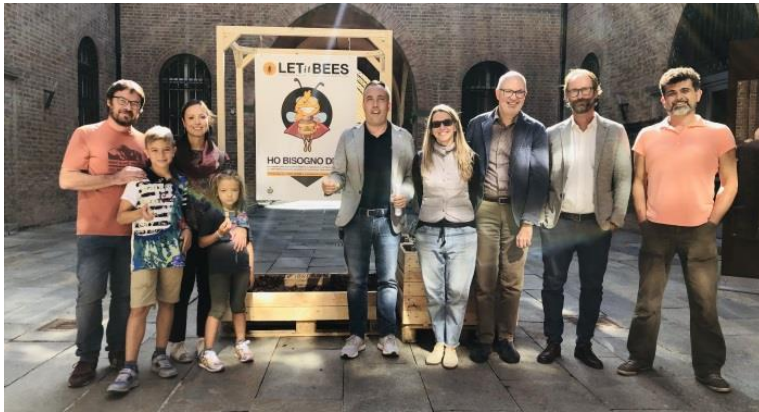
Zdj. 2: Grupa robocza Fidenzy