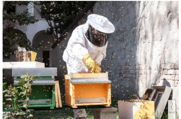
Zdj. 3: Pszczelarze miejscy w Cremonie w akcji

Ponadto, w dobie internetu i sieci, działania mające na celu podnoszenie świadomości mogą i powinny być współdzielone , aby uczynić je bardziej skutecznymi i oddziałyującymi na znacznie większą skalę. Z tego powodu budowane są silniejsze powiązania przy udziale projektów uzupełniających, które w różnych miastach podchodzą do tego samego tematu, a ich wspólnym celem jest stworzenie przyjaznego środowiska miejskiego dla pszczół i zapylaczy.