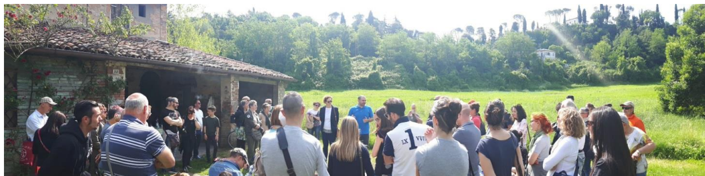
Zdj. 1: Obywatele słuchający opowieści pszczelarzy - Światowy Dzień Pszczoł 2019 r. w Cesenie

Organizacja imprez jest również potężnym instrumentem przyciągającym uwagę obywateli. Przy prowadzeniu dobrej pracy komunikacyjnej duże wydarzenia mogą dotrzeć do ludzi i tym samym dużą część z nich zaangażować. Tak właśnie uczyniono w tym roku, aby po raz pierwszy w Cesenie świętować Światowy Dzień Pszczoł (zdj. 1). Wydarzenie to było pierwszą okazją do nawiązania kontaktów między instytucjami, stowarzyszeniami, firmami, obywatelami, którzy w Cesenie dbają o miejską różnorodność biologiczną i ochronę zapylaczy. Sukces tego wydarzenia pokazał, że jeśli jest ono odpowiednio stymulowane, opinia publiczna staje się teraz wrażliwa na tematy naszego projektu.