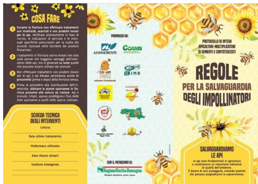
Rys. 2: Narzędzie rozpowszechniania protokołu podpisanego na szczeblu regionalnym przez pszczelarzy i przedsiębiorstwa nasienne

Równolegle w tym roku szkoła podstawowa w Cesenie będzie miała okazję do przetestowania precyzyjnej ścieżki edukacyjnej dotyczącej pszczoł , zapylaczy i pszczelarstwa. Pszczelarz podczas zajęć pokaże uczniom prawdziwy ul pszczeli i pracowite życie pszczoł.