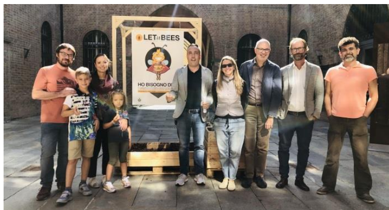
Slika 4: delovna skupina Fidenza