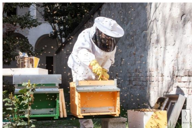
Slika 5: Cremonin urbani čebelar na delu