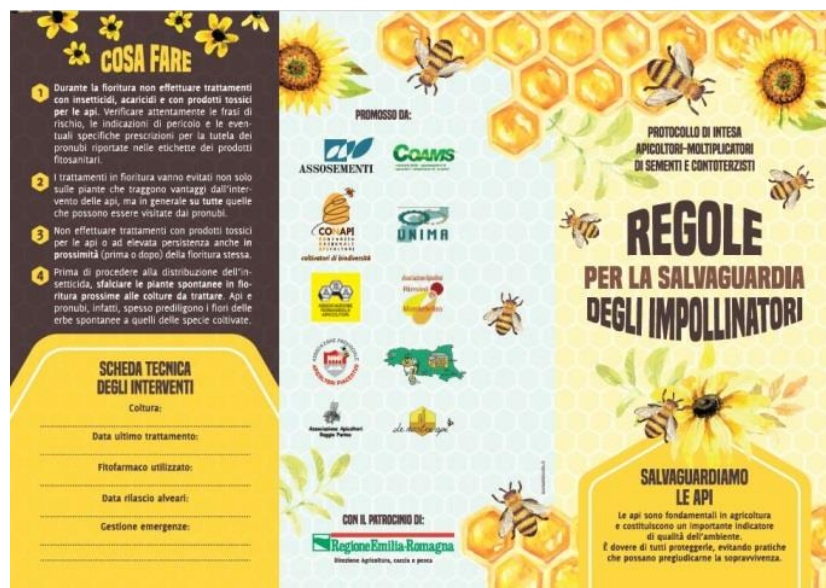
Slika 2: Informacijska zloženka s pravili za ohranjanje opraevalcev, ki so jih na regionalni ravni določili čebelarji in podjetja s semeni

Sočasno s tem bodo letos učenci osnovne šole v Ceseni imeli priložnost izkusiti izobraževalno pot o čebelah , opraevalcih in čebelarstvu, čebelar pa bo učencem v razredih pokazal pravi čebeljak in predstavil zelo zaposleno življenje čebel.