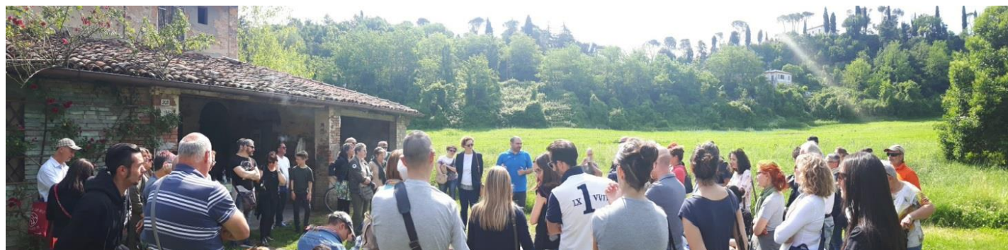
Slika 3: Državljeni poslušajo zgodbe o čebelarstvu – Trenutek v Svetovnem dnevu čebel 2019 v Ceseni

Prav tako je močno orodje organizacija dogodkov s katerim pritegnemo pozornost prebivalcev mesta. S premišljenim komunikacijskim pristopom lahko ljudi dosežemo in jih tudi vključimo. Tako smo naredili letos ob, prvič v Ceseni, praznovanju Svetovnega dneva čebel (slika 3). S prireditvijo smo prvič povezali institucije, društva, podjetja in prebivalce, ki v Ceseni skrbijo za urbano biodiverzitetu in ohranjanje opraevalcev. Uspeh dogodka je pokazal, da se širša javnost odziva na temo projekta, če le jo pravilno spodbudimo.