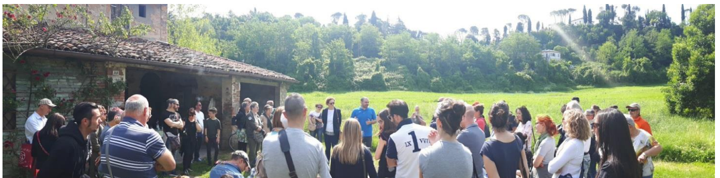
Fig.3: Cidadãos ouvindo histórias dos apicultores - Um momento do Dia Mundial da Abelha de 2019 em Cesena

A organização de eventos também é um instrumento poderoso para chamar a atenção dos cidadãos. Se apoiados por um bom trabalho de comunicação, podem alcançar as pessoas e envolvê-las. Foi o que foi feito este ano para celebrar, pela primeira vez em Cesena, o Dia Mundial das Abelhas (Fig. 3). Este evento foi a primeira ocasião de articular instituições, associações, empresas, cidadãos que em Cesena cuidam da biodiversidade urbana e da conservação de polinizadores. O sucesso do evento mostrou que, se estimulado adequadamente, o público em geral é agora sensível aos tópicos do nosso projeto.