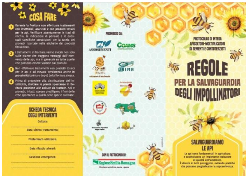
Fig. 2: a ferramenta de divulgação do protocolo assinado a nível regional por empresas de apicultores e sementes

Paralelamente este ano, a escola primária de Cesena terá a oportunidade de experimentar um percurso educativo preciso sobre abelhas , polinizadores e apicultura, enriquecido pela presença de um apicultor na sala, mostrando aos alunos uma verdadeira colméia e a vida agitada das abelhas.