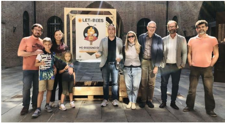
Fig.4: Grupo de trabalho de Fidenza