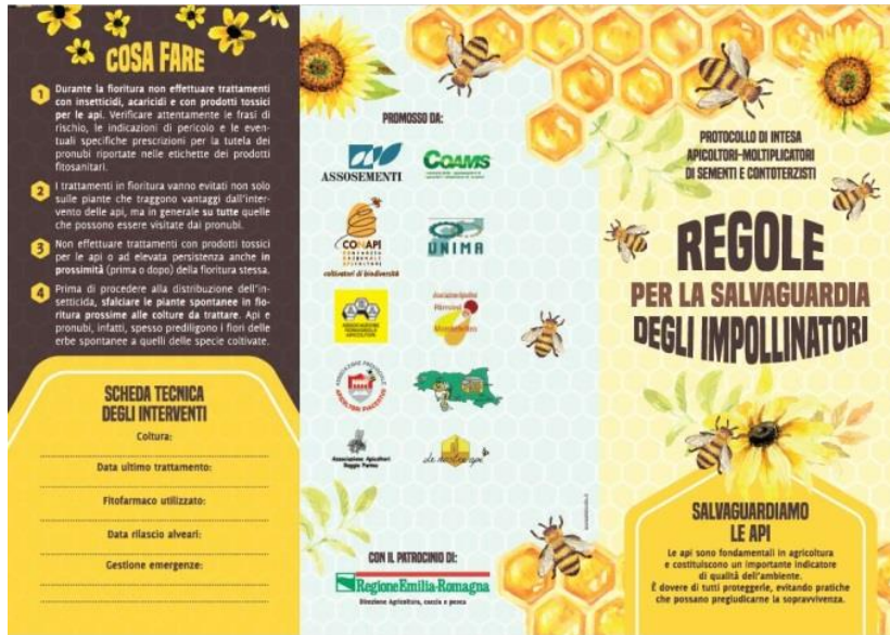
2. Kép: méhészeti és vetőmagtársaságok logójával ellátott szóróanyag

Ezzel párhuzamosan a Cesenai általános iskolának lehetősége nyílik meglátogatni egy konkrét oktatási méh-sétányt beporzókkal, méhészkedéssel, és egy igazi méhésszel, aki bevezeti a gyerekeket a méhek sürgő-forgó életébe.