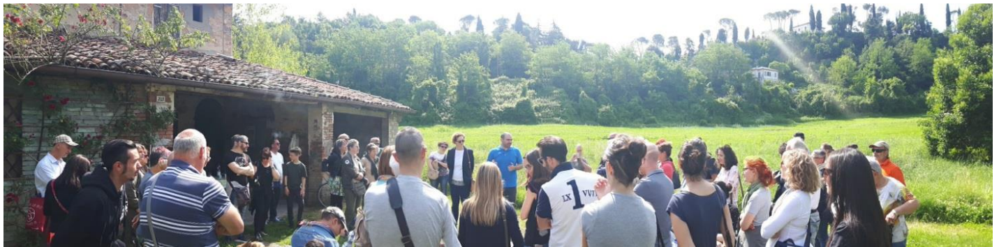
3. Kép: Helyiek hallgatják a méhész előadását – pillanatkép a 2019-es cesenai Méh Világ Napról

Nyílt események szervezése ugyancsak kiváló alkalmat biztosítanak lakossági bevonásra. Amennyiben megfelelő kommunikáció kíséri őket, rengeteg embert tudnak megszólítani és bevonni. Erre a sinergiára eklatáns példa az idén első alkalommal szervezett Nemzetközi Méh Nap. (3. Kép). A rendezvény lehetőséget biztosított azon intézmények, egyesületek, a vállalatok és helyi lakosok együttműködésére, akiknek fontos a városi biológiai sokféleség megőrzése és a beporzók védelme. Az esemény sikere nyilvánvalóvá tette, hogy megfelelő ösztönzéssel a szélesebb közönség is érzékeny a project témája iránt.