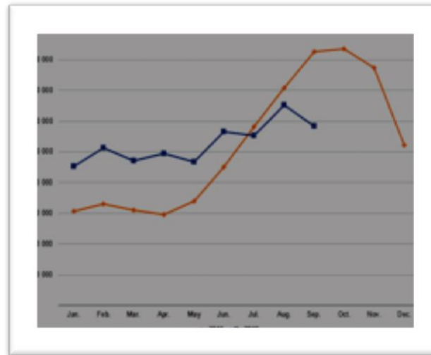
Eurostat, στατιστικά στοιχεία για προσφυγικές ροές 2015-2016

Είναι ένα διεθνές πρόγραμμα που θα διαρκέσει δυο χρόνια (2016 - 2018) και θα προσφέρει μια πλατφόρμα στις 10 συμμετέχουσες πόλεις όπου φορείς και οργανώσεις θα έχουν την ευκαιρία να ανταλλάξουν καλές εμπειρίες σε θέματα μετανάστευσης, αντιμετώπισης προσφυγικών ροών, κοινωνικής ένταξης και κοινωνικής συνοχής και στηρίζεται από το URBACT της Ε.Ε.. Το URBACT είναι ένα πρόγραμμα που στόχο έχει την ανταλλαγή καλών πρακτικών σε Ευρωπαϊκό επίπεδο για την προώθηση της αειφόρου ανάπτυξης.